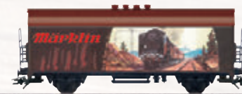
45901 Märklin-Katalogwagen 1930 – Nutzen Sie bitte zum Wechsel den Gleichstromradsatz E32376004