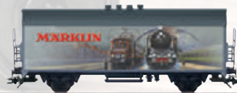
45900 Märklin-Katalogwagen 1929 – Nutzen Sie bitte zum Wechsel den Gleichstromradsatz E32376004