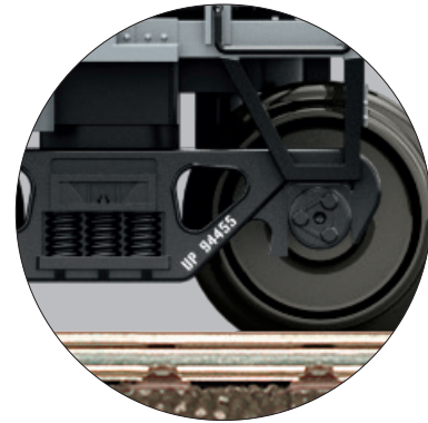
Vorbildgerecht bis ins Detail bedruckt

Die ideale Ergänzung aus unserem Trix H0 Programm – vorgestellt in den Messeneuheiten 2023